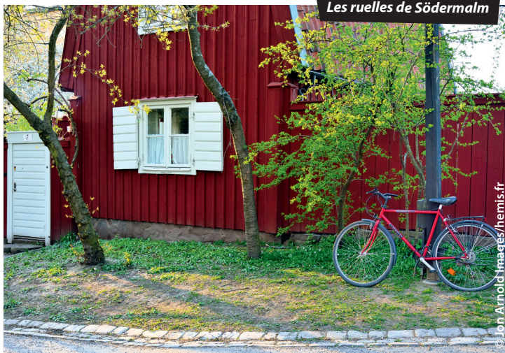
Les ruelles de Södermalm

☎ 112 : c'est le numéro d'urgence commun à la France et à tous les pays de l'UE, à composer en cas d'accident, agression ou détresse. Il permet de se faire localiser et aider en français, tout en améliorant les délais d'intervention des services de secours.