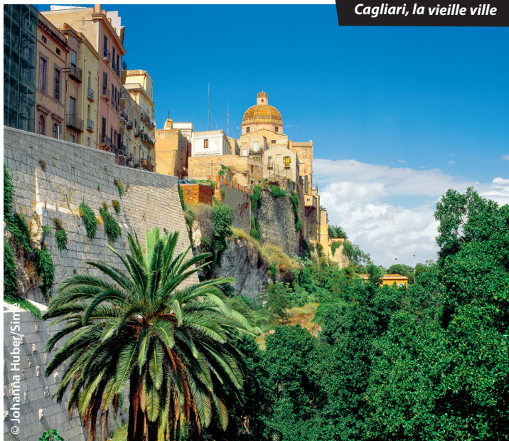
Cagliari, la vieille ville

☎ 112 : c'est le numéro d'urgence commun à la France et à tous les pays de l'UE, à composer en cas d'accident, agression ou détresse. Il permet de se faire localiser et aider en français, tout en améliorant les délais d'intervention des services de secours.