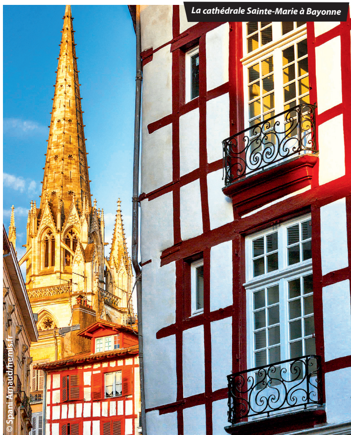
La cathédrale Sainte-Marie à Bayonne

☎ 112 : c'est le numéro d'urgence commun à la France et à tous les pays de l'UE, à composer en cas d'accident, agression ou détresse. Il permet de se faire localiser et aider en français, tout en améliorant les délais d'intervention des services de secours.