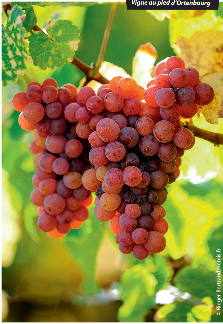
Vigne au pied d'Ortenbourg

Sauf exception, Le Routard bénéficie d'une parution annuelle à date fixe. Entre deux dates, des événements fortuits (formalités, taux de change, catastrophes naturelles, conditions d'accès aux sites, fermetures inopinées) peuvent intervenir et modifier vos projets en voyage. Pour éviter les déconvenues, nous vous recommandons de consulter la rubrique « Guide » par pays de notre site • routard.com • et plus particulièrement les dernières Actus voyageurs .