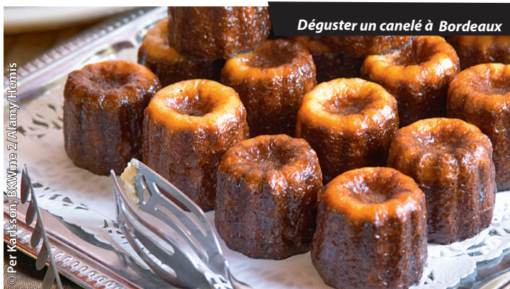
Déguster un canelé à Bordeaux

☛ 112 : c'est le numéro d'urgence commun à la France et à tous les pays de l'UE, à composer en cas d'accident, agression ou détresse. Il permet de se faire localiser et aider en français, tout en améliorant les délais d'intervention des services de secours.