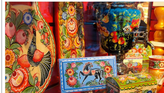
Pièces d'artisanat russes dans une boutique de Gostiny Dvor, Nevski prospekt