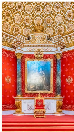
La petite salle du Trône rénovée au palais d'Hiver, musée de l'Ermitage