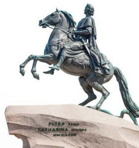
Le Cavalier de bronze, érigé en hommage à Pierre le Grand