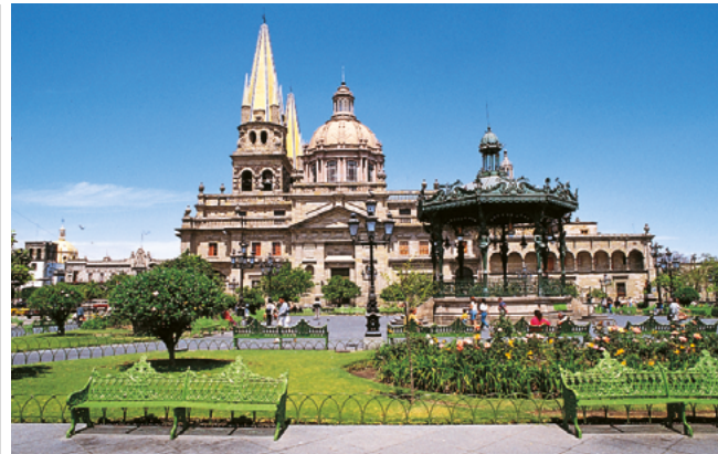
Plaza de Armas et cathédrale, Guadalajara