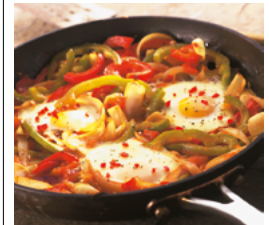
Les huevos rancheros, plat mexicain traditionnel