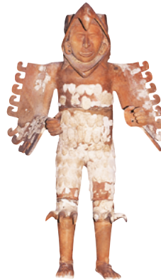
Statue en argile d'un guerrier aztèque, Museo del Templo Mayor, Mexico