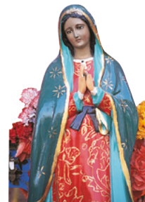
Vierge de Guadalupe