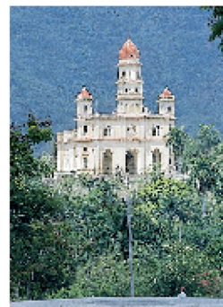
La basilica del Cobre, un haut lieu de pèlerinage (p. 225)