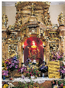
L'autel du santuario de San Lázaro, aux environs de La Havane (p. 121)