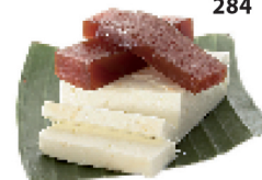
Pâte de goyave ( guayaba ) et fromage