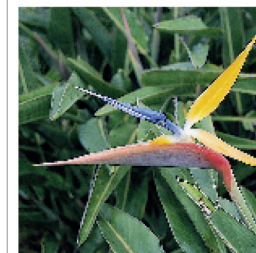
Oiseau de paradis dans le jardin Avenida del Paraíso, parque Baconao (p. 238-241)