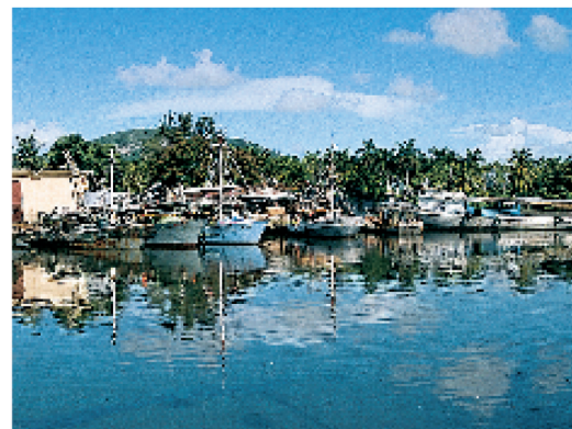
Bateaux de pêche dans le port de Nueva Gerona, Isla de la Juventud (p. 152-155)