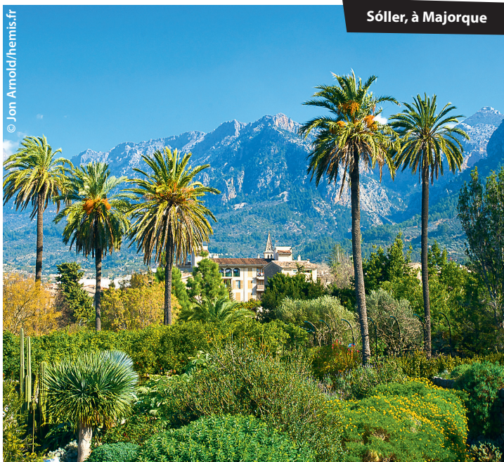
Sóller, à Majorque