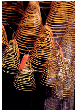
Spirales d'encens, temple de Thien Hau (p. 74)