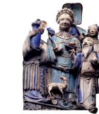
Sculptures au temple de Thien Hau

La côte et les hauts plateaux du Sud 106