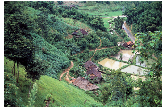
Huttes en bois sur pilotis au milieu des rizières inondées près de Son La