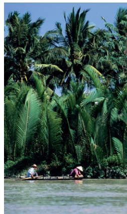
Pêcheurs au travail sur une voie d'eau du delta du Mékong