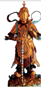
Sculpture de la pagode Dieu De, Hué

Le delta du Mékong et le Vietnam du Sud 88