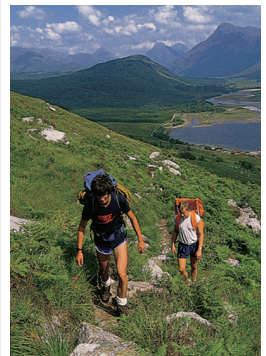
Balade dans le Glen Etive par une belle journée d'été

Carte routière de l'Écosse Rabat arrière de couverture