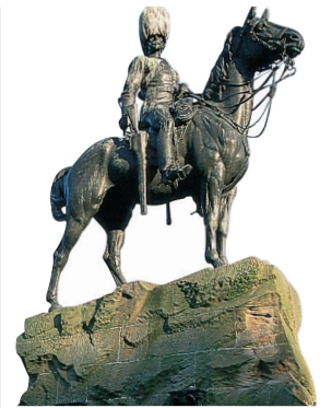
Mémorial aux soldats écossais de la guerre des Boers