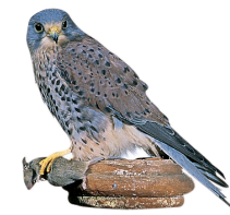
Faucon des Highlands