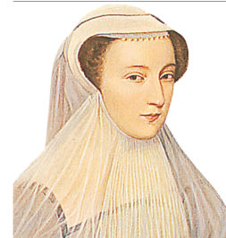
Marie Stuart (1542-1587), reine d'Écosse