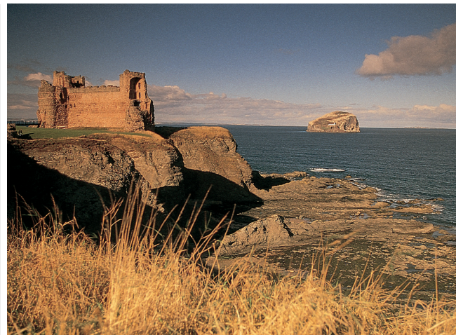
Les ruines spectaculaires de Tantallon Castle sur la côte sud-est