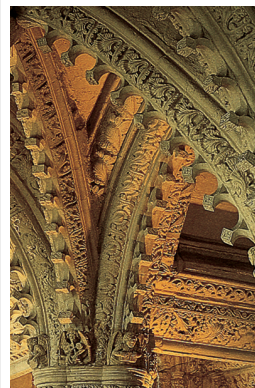
Les voûtes sculptées de la Rosslyn Chapel dans les Pentlands Hills