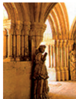
Entrée de la salle capitulaire du mosteiro de Alcobaça, Estremadura