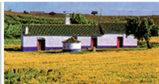
Maison aux décorations bleues typiques près de Beja, Alentejo