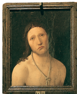
Ecce Homo d'Antonello da Messina, palazzo Spinola, Gênes