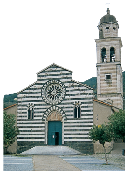
L'église gothique de Sant'Andrea, à Levanto