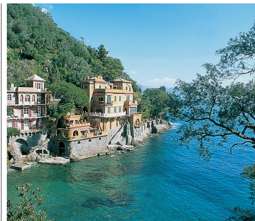
Paysage de carte postale à Paraggi, près de Portofino