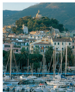
Le port de San Remo, l'une des stations les plus populaires de la côte