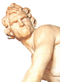
David, œuvre du Bernin, Rome