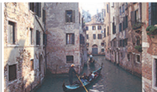
Gondoles sur un canal vénitien