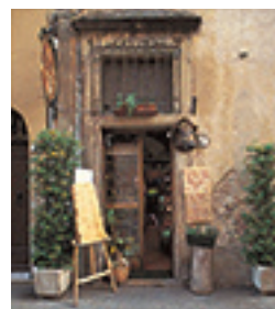
Petit magasin de souvenirs, Volterra en Toscane