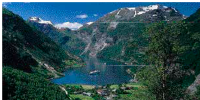
Vue sur le Geirangerfjord