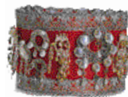
Couronne nuptiale provenant du Hallingdal (p. 28)