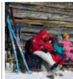
Skieurs adossés à un chalet de Trysil, Norvège de l'Est