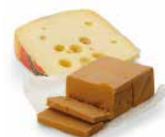
Fromages: le geitost et le jarsberg