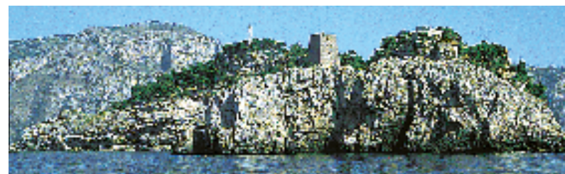
L'archipel des Li Galli, au large de Sorrente