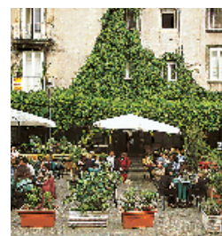
Terrasse de café sur la Piazza Bellini, à Naples