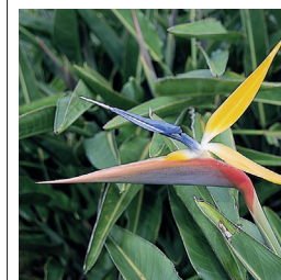
Oiseau de paradis dans le jardin Avenida del Paraíso, parque Baconao (p. 238-241)