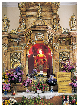
L'autel du santuario de San Lázaro, aux environs de La Havane (p. 121)