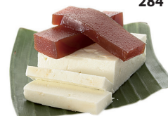
Pâte de goyave (guayaba) et fromage