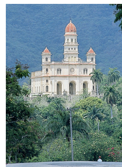
La basilica del Cobre, un haut lieu de pèlerinage (p. 225)