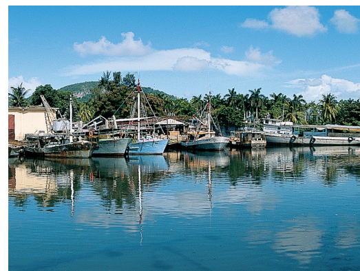
Bateaux de pêche dans le port de Nueva Gerona, isla de la Juventud (p. 152-155)