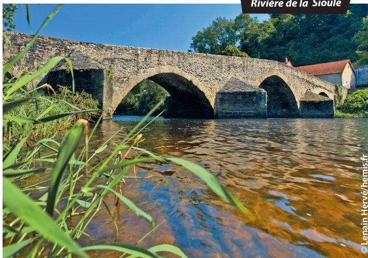
Rivière de la Sioule

À l'hôtel, pensez à les demander au moment de la réservation ou, si vous n'avez pas réservé, à l'arrivée . Ils ne sont valables que pour les réservations en direct et ne sont pas cumulables avec d'autres offres promotionnelles (notamment sur internet). Au restaurant, parlez-en au moment de la commande et surtout avant que l'addition soit établie. Poser votre Routard sur la table ne suffit pas : le personnel de salle n'est pas toujours au courant et une fois le ticket de caisse imprimé, il est souvent difficile de modifier le total. En cas de doute, montrez la notice relative à l'établissement dans Le Routard de l'année et, bien sûr, ne manquez pas de nous faire part de toute difficulté rencontrée.