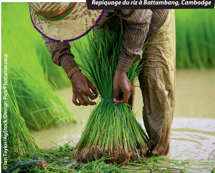
Repiquage du riz à Battambang, Cambodge