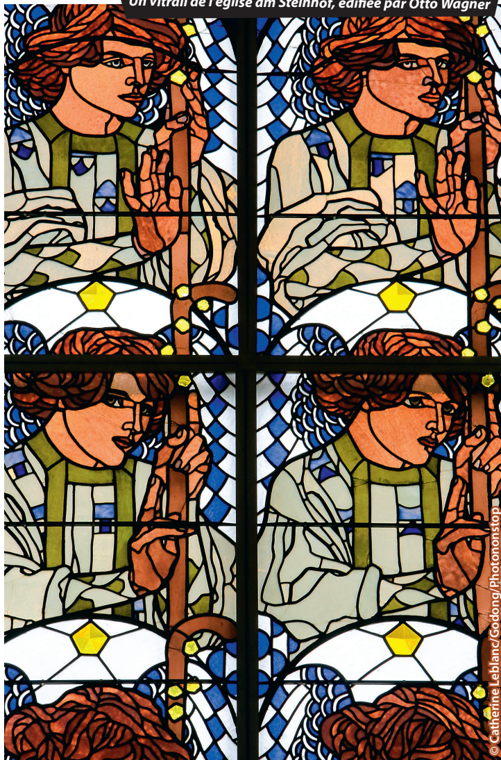
Un vitrail de l'église am Steinhof, édifiée par Otto Wagner

☎ 112 : c'est le numéro d'urgence commun à la France et à tous les pays de l'UE, à composer en cas d'accident, agression ou détresse. Il permet de se faire localiser et aider en français, tout en améliorant les délais d'intervention des services de secours.