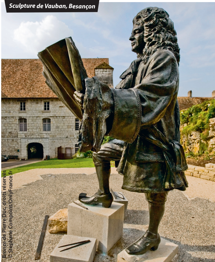
Sculpture de Vauban, Besançon

Bronze de Pierre Duc, droits réservés © Stéphane Compoint/OnlyFrance.fr