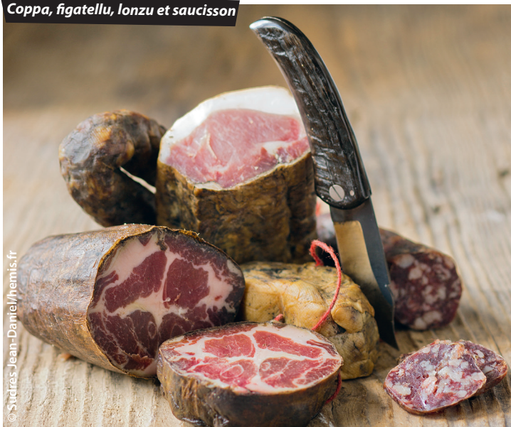
Coppa, figatellu, lonzu et saucisson

À l'hôtel, pensez à les demander au moment de la réservation ou, si vous n'avez pas réservé, à l'arrivée . Ils ne sont valables que pour les réservations en direct et ne sont pas cumulables avec d'autres offres promotionnelles (notamment sur Internet). Au restaurant, parlez-en au moment de la commande et surtout avant que l'addition soit établie. Poser votre Routard sur la table ne suffit pas : le personnel de salle n'est pas toujours au courant et une fois le ticket de caisse imprimé, il est souvent difficile de modifier le total. En cas de doute, montrez la notice relative à l'établissement dans le Routard de l'année et, bien sûr, ne manquez pas de nous faire part de toute difficulté rencontrée.