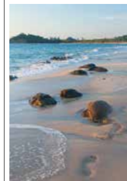
Plage Ngapali, sur le golfe du Bengale, Ouest de la Birmanie