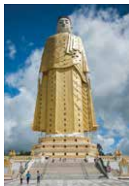
Bouddha colossal de Bodhi Tataung, Mandalay