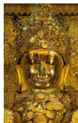
Bouddha Mahamuni de Mandalay, couvert d'or par les dévots