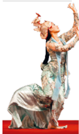
Danse classique birmane au palais Karaweik de Yangon