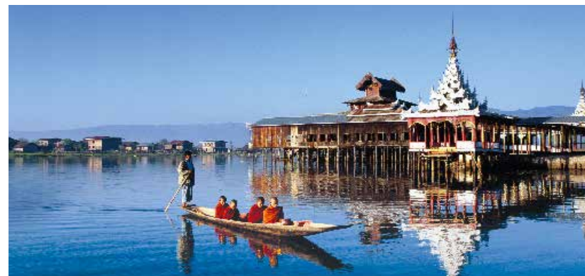
Moines passant en barque devant le monastère Nga Phe Kyaung sur le lac Inle, Est de la Birmanie