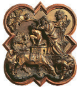
Relief de Brunelleschi, Bargello