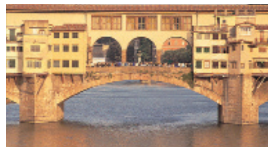
Le Ponte Vecchio de Florence et ses bijouteries au-dessus de l'Arno