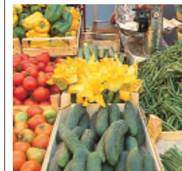
Fleurs de courgette au marché