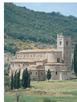
Église abbatiale de Sant'Antimino