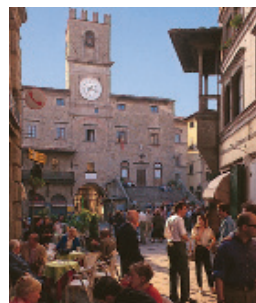
Piazza della Repubblica, Cortone

Histoire de Florence et de la Toscane 44