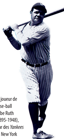
Le joueur de base-ball Babe Ruth (1895-1948), star des Yankees de New York