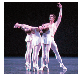
New York City Ballet