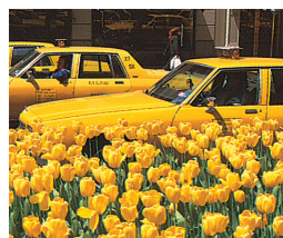
Les célèbres taxis jaunes new-yorkais