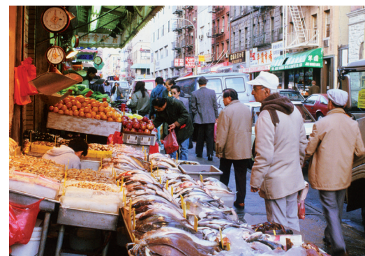
Étal de légumes et de poisson à Chinatown