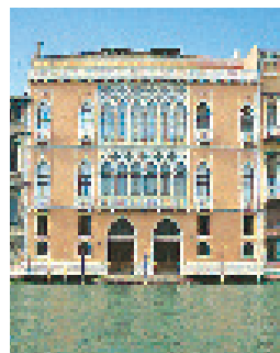
Le palazzo Pisani Moretta, sur le Grand Canal