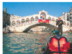
Le pont du Rialto, sur le Grand Canal