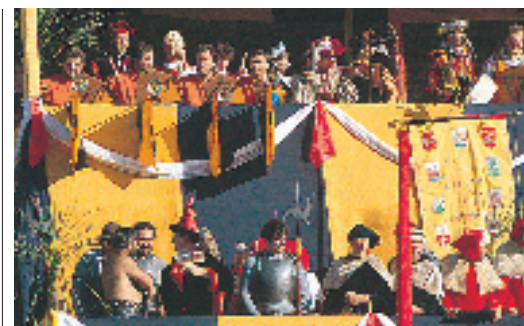
Le Palio dei Dieci Comuni, à Montagnana