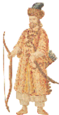
Le voyageur vénétien Marco Polo