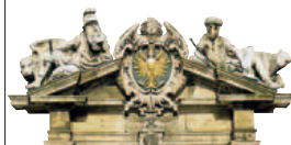
Écu héraldique dominant l'entrée de l'hôtel de ville de Nuremberg