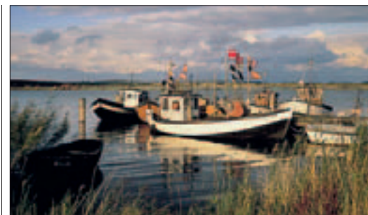
Paysage pittoresque au Mecklembourg