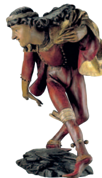
Statue de danseur, Stadtmuseum de Munich (p. 214)