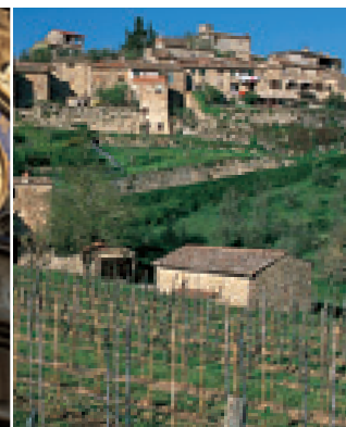
Gauche David de Michel-Ange Droite Le hameau de Montefioralle