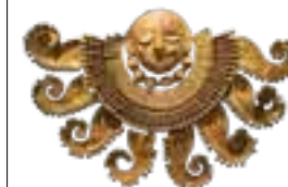
Pectoral en or du Señor de Sipán