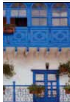
Balcons bleus richement sculptés, Cuzco