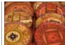
Assiettes peintes aux couleurs vives, marché de Chincho