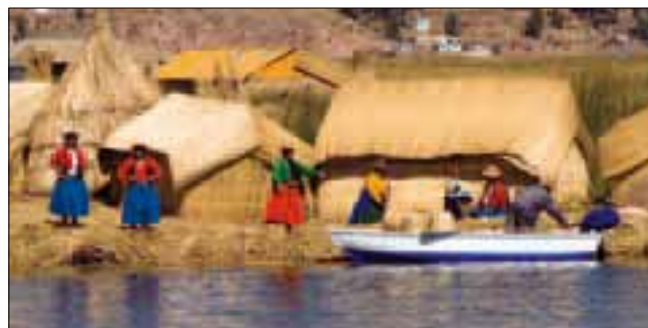
Habitants des Islas Uros, lac Titicaca

Achevé d'imprimer en décembre 2012 Dépôt légal : décembre 2012 ISBN : 978-2-01-245228-2 ISSN : 1246-8134 Collection 32 – Édition 01 N° de codification : 24-5228-2