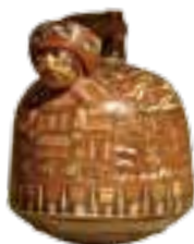
Cruche nazca en céramique décorée de motifs stylisés