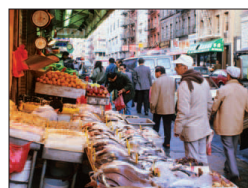
Chinatown, Lower East Side