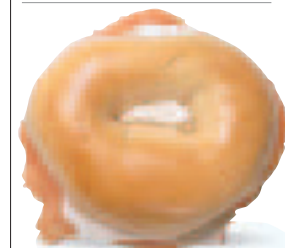
Bagel d'un deli de New York