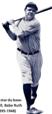
La star du base- ball, Babe Ruth (1895-1948)