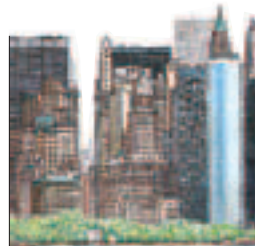
La pointe sud de Manhattan