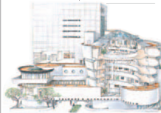
Solomon R. Guggenheim Museum, Upper East Side