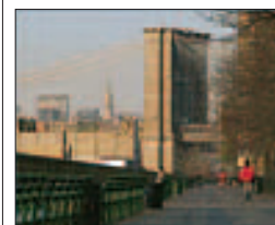
Promenade au bord de l'eau, à Brooklyn