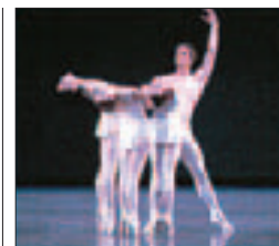
Le New York City Ballet