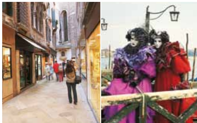
Gauche Boutiques des Mercerie Droite Camaval de Venise