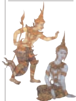
Lakshman et Sita, personnages du Ramakien