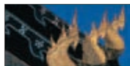
Cho fas, Wat Tan Pao de Chiang Mai