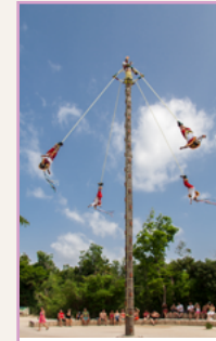
La côte du golfe Pages 242-259