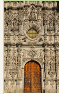
Les environs de Mexico Pages 134-161