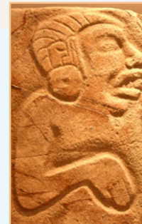
Le Sud du Mexique Pages 216-241