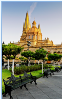
Le cœur colonial Pages 184-215