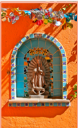
San Ángel et Coyoacán Pages 100-109