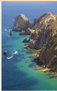
Le Nord du Mexique Pages 162-183