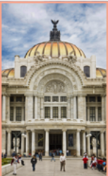
Le centre historique Pages 64-85