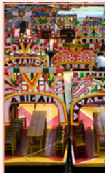
En dehors du centre Pages 110-117