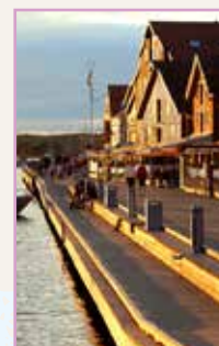
Autour de l'Oslofjord Pages 116-129