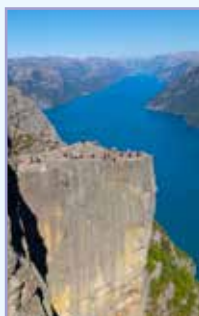
Le Vestland Pages 164-191