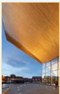
Le Sørland et le Telemark Pages 148-163