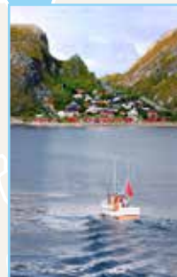
La Norvège du Nord et le Svalbard Pages 206-225