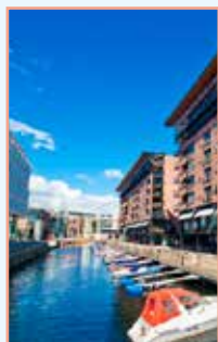
Oslo Pages 46-113