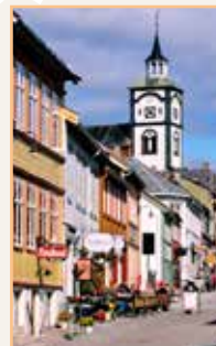
Le Trøndelag Pages 192-205