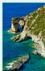
Les îles Ioniennes Pages 72-95