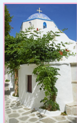
Les îles Argo- Saroniques Pages 96-107