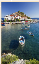
Les Sporades et l'Eubée Pages 108-127