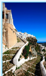
Les Cyclades Pages 208-247