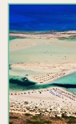
La Crète Pages 248-285