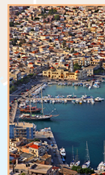
Le Dodécanèse Pages 162-207