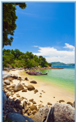
La côte nord de la mer d'Andaman Pages 356-377