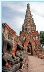
Le sud de la Plaine centrale Pages 168-189