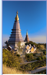
La région de Chiang Mai Pages 216-241