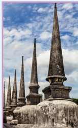
La frontière malaise Pages 378-395