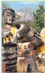
Le nord de la Plaine centrale Pages 190-205