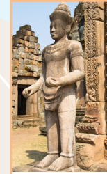
Le plateau de Khorat Pages 272-285