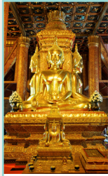
Le Triangle d'or Pages 242-263