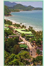
La région de Pattaya Pages 316-327