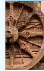
L'Odisha Pages 260-273