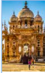
Le Gujarat Pages 338-357