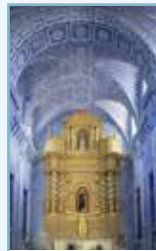
Goa Pages 398-421