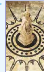
Calcutta (Kolkata) Pages 228-243