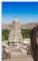
Le Karnataka Pages 422-451