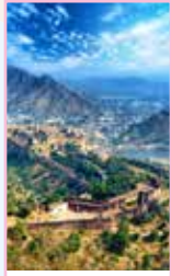
Le Rajasthan Pages 292-337