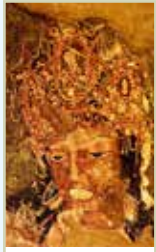
Le Maharashtra Pages 382-397