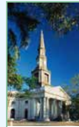
Madras (Chennai) Pages 456-473