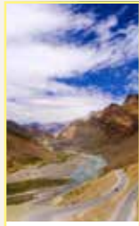
Le Ladakh et le Jammu-et-Cachemire Pages 126-141