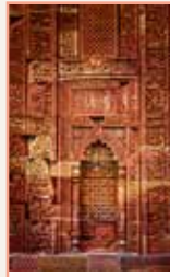
Delhi Pages 66-93