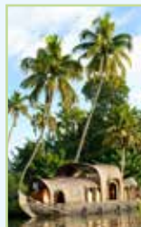
Le Kerala Pages 514-541