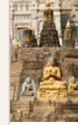
Le Bihar et le Jharkhand Pages 184-197