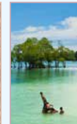
Les îles Andaman Pages 506-513