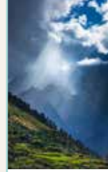
L'Himachal Pradesh Pages 104-125