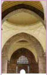
Bombay (Mumbai) Pages 362-381