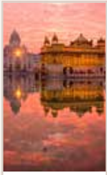
L'Haryana et le Pendjab Pages 94-103