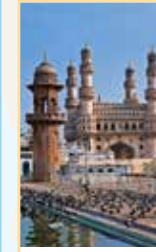
L'Andhra Pradesh Pages 542-565