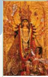
Le Bengale-Occidental et le Sikkim Pages 244-259