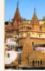
L'Uttar Pradesh et l'Uttarakhand Pages 146-183