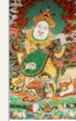
L'Assam et le Nord-Est Pages 274-287