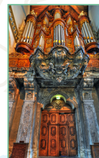
Oude Zijde Pages 58-71