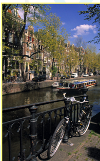
Du musée de la Bible à Leidseplein Pages 108-115