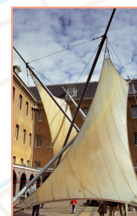
Le quartier de Plantage Pages 140-149