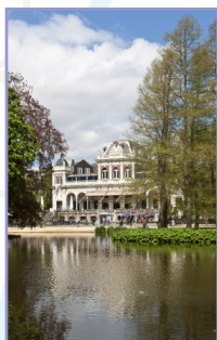
Le quartier des musées Pages 126-139