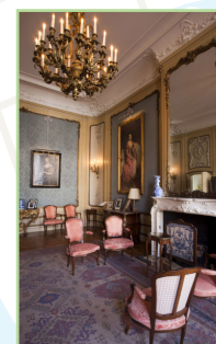
De l'Amstelveld au Singelgracht Page 116-125