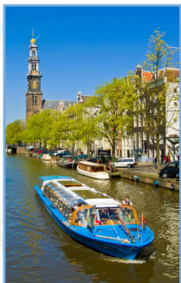
Le Jordaan Pages 88-95