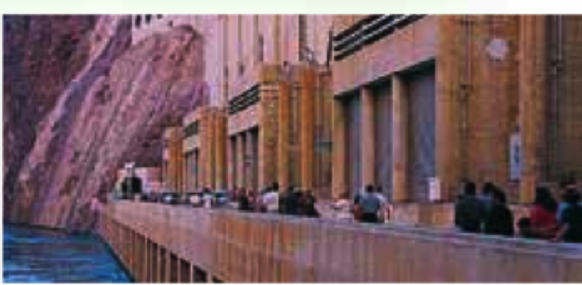
Gauche Grand Canyon Centre gauche Marina du lake Mead Centre droite Casino Binion's Horseshoe Droite Hoover Dam