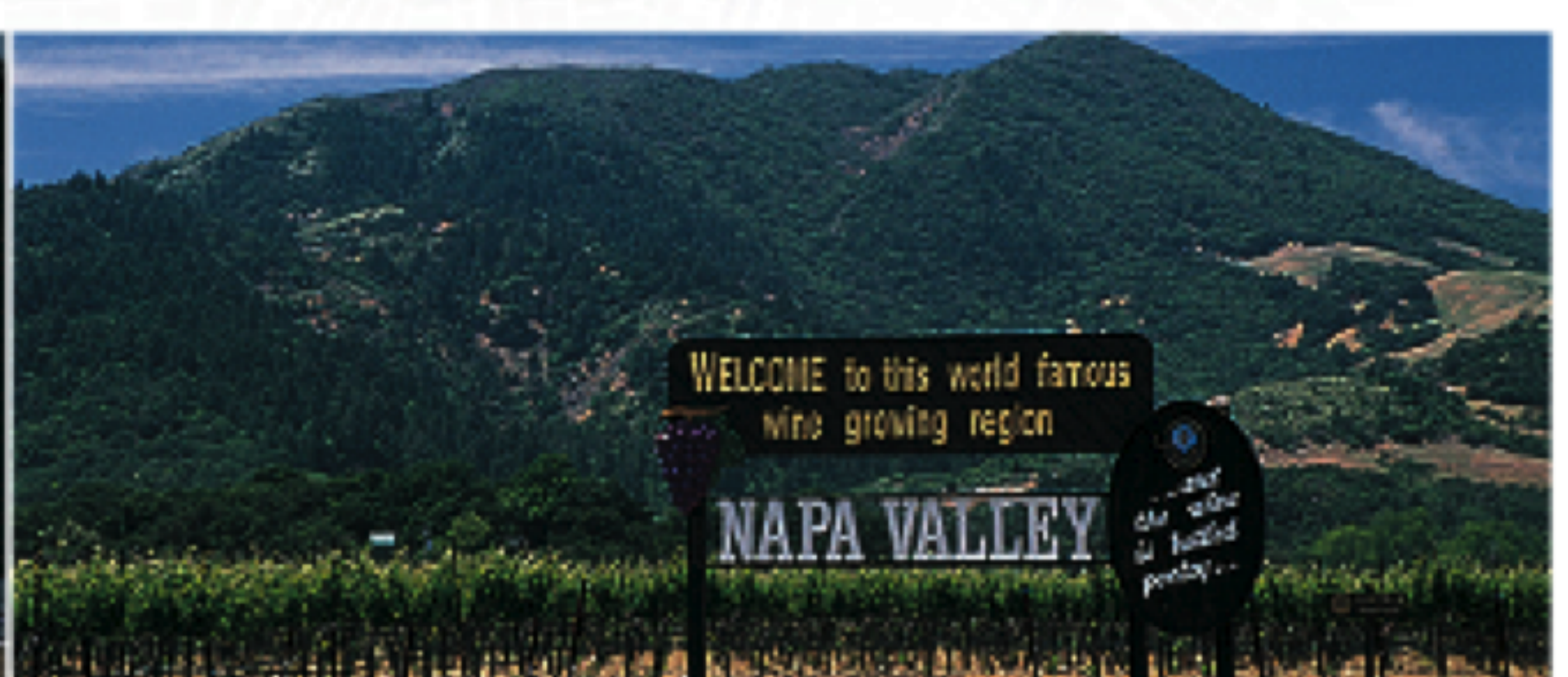
Gauche Cable cars Centre Marina District Droite Panneaux, Napa Valley