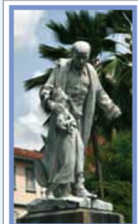
FORT-DE-FRANCE Pages 72-93