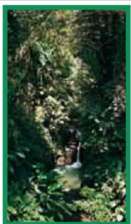
LE NORD CARAÏBE Pages 94-121