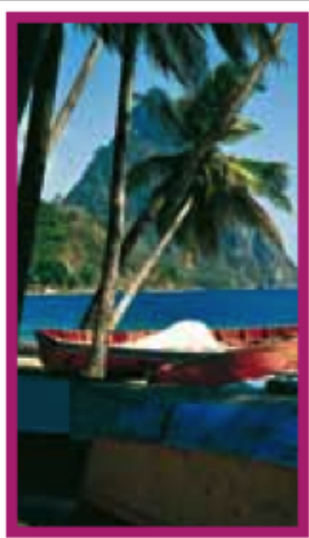
LES ÎLES SAINTE-LUCIE, SAINT-VINCENT ET LES GRENADINES Pages 186-203