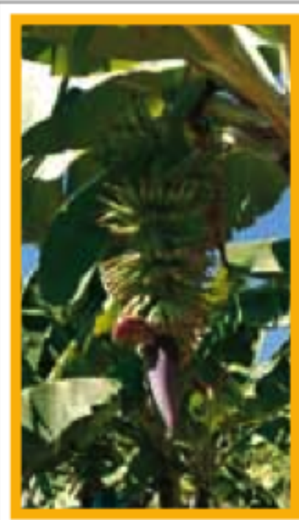
LE NORD ATLANTIQUE Pages 122-147