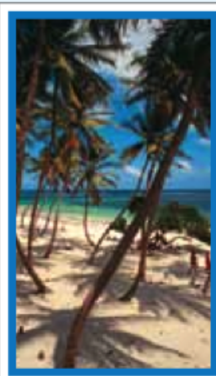
LE SUD ATLANTIQUE Pages 168-185