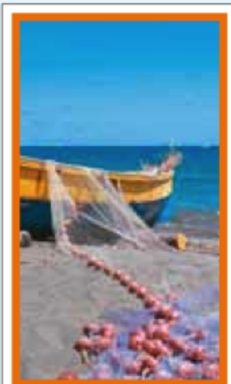
LE SUD CARAÏBE Pages 148-167