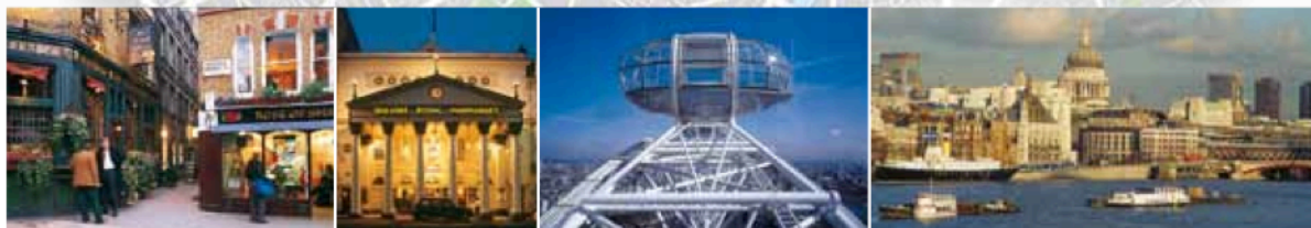
Gauche Shepherd Market Centre gauche Royal Opera House Centre droite London Eye Droite Vue de la City