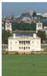
Queen's House, Greenwich

Ce guide divise Londres en 8 quartiers du centre, et ses environs en 3 parties : le Nord, l'Est et le Sud et l'Ouest. Le plan ci-dessous montre la situation et l'étendue de ces parties. Chaque quartier est identifiable par une couleur reprise tout au long du guide. Les principaux sites mentionnés dans cet ouvrage comportent une référence permettant de les repérer sur les 2 plans généraux situés sur les rabats au début et à la fin du guide.