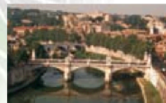
Ci-dessus Le Tibre