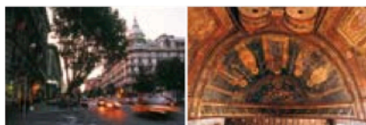
Gauche Via Veneto Droite Santa Maria in Cosmedin

Ce guide divise la ville en huit quartiers du centre, dont le plan ci-dessous montre la situation et l'étendue. Un chapitre est consacré aux environs de Rome. Chaque quartier est repéré par une couleur reprise tout au long du guide. Les principaux sites mentionnés dans cet ouvrage comportent une référence permettant de les situer sur les deux plans généraux des rabats au début et à la fin du guide.