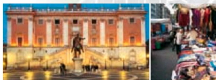
Gauche Piazza del Campidoglio Droite Marché de la via Sannio