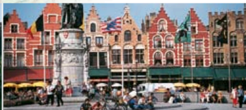
Gauche Palais royal, Bruxelles Centre Minnewater, Bruges Droite Markt, Bruges