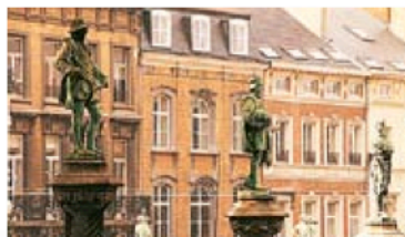
Place du Petit-Sablon, Bruxelles

Ce guide présente ces quatre cités historiques séparément – Bruxelles est divisée en deux parties : le centre et la périphérie. La carte ci-dessous indique la localisation des quatre villes les unes par rapport aux autres. Chaque ville (chaque partie en ce qui concerne Bruxelles) est identifiable par une couleur reprise tout au long du guide. Presque tous les sites mentionnés dans cet ouvrage comportent une référence cartographique qui permet de les repérer sur les plans situés sur les rabats, au début et à la fin du guide.