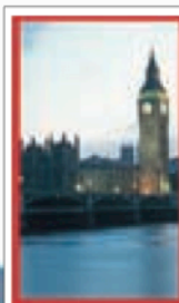
LONDRES Pages 70-143