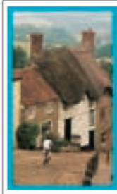
LE WESSEX Pages 234-259