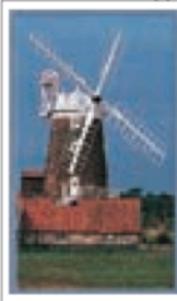
L'EAST ANGLIA Pages 178-203