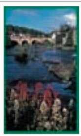
LE NORD DU PAYS DE GALLES Pages 426-441