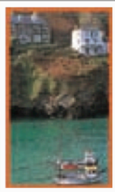
LE DEVON ET LES CORNOUAILLES Pages 260-283