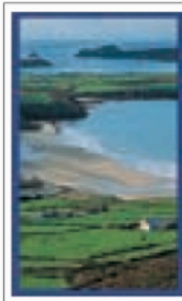
LE CENTRE ET LE SUD DU PAYS DE GALLES Pages 442-461