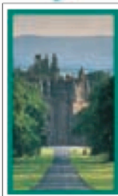
LES LOWLANDS Pages 476-509