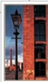
LE LANCASHIRE ET LES LACS Pages 342-365