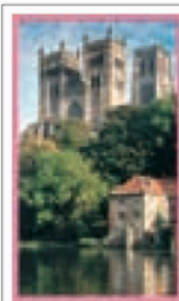
LA NORTHUMBRIA Pages 400-415