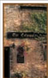
LE CŒUR DE L'ANGLETERRE Pages 294-317