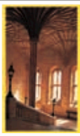
LA VALLÉE DE LA TAMISE Pages 204-225