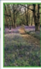
LES DOWNS ET LES CÔTES DE LA MANCHE Pages 152-177