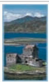
LES HIGHLANDS ET LES ÎLES Pages 510-535