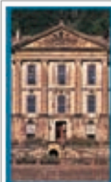
L'EST DES MIDLANDS Pages 318-331