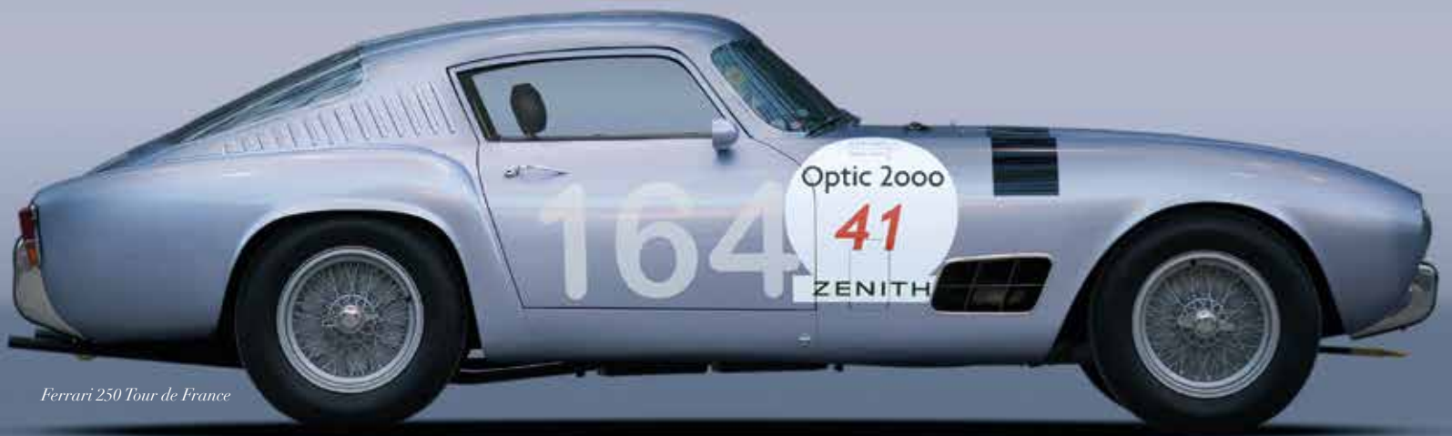
Ferrari 250 Tour de France