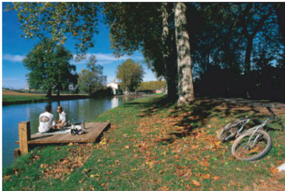
Déjeuner sur l'eau, entre Toulouse et Villefranche-de-Lauragais, pour ces randonneurs-cyclistes du chemin de halage.