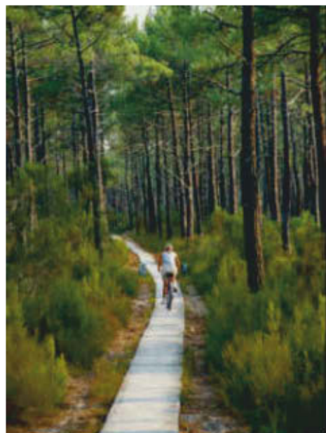
Voie verte dans la forêt des Landes.