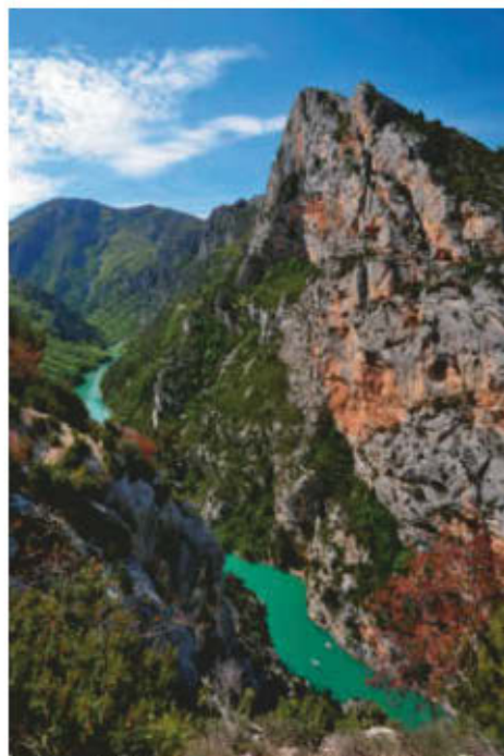
Les gorges du Verdon, des paysages époustouffants !