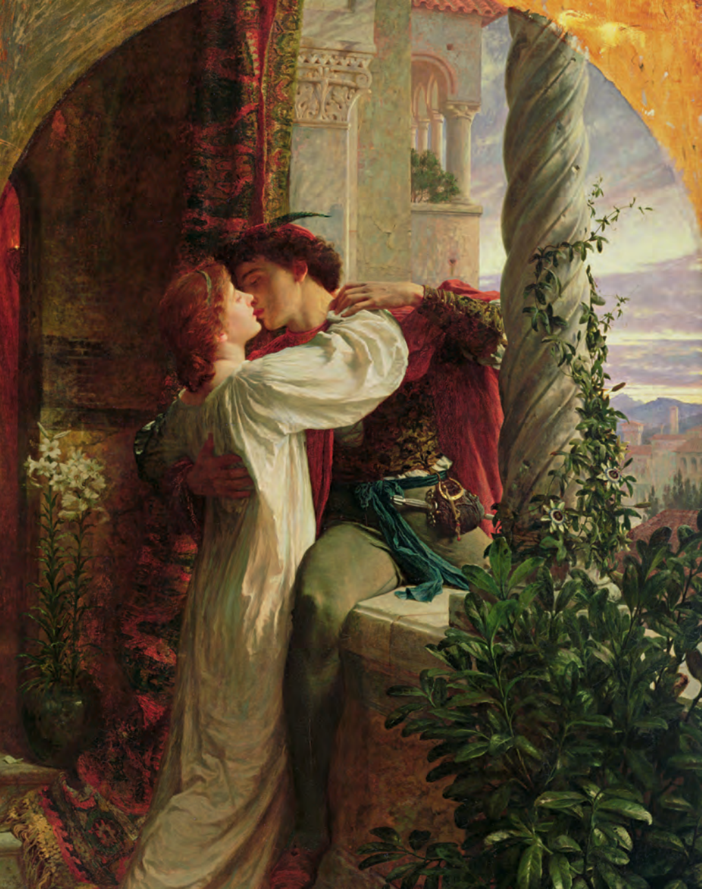
Frank Dicksee, Roméo et Juliette , 1884, huile sur toile, Southampton City Art Gallery, Southampton (Royaume-Uni).