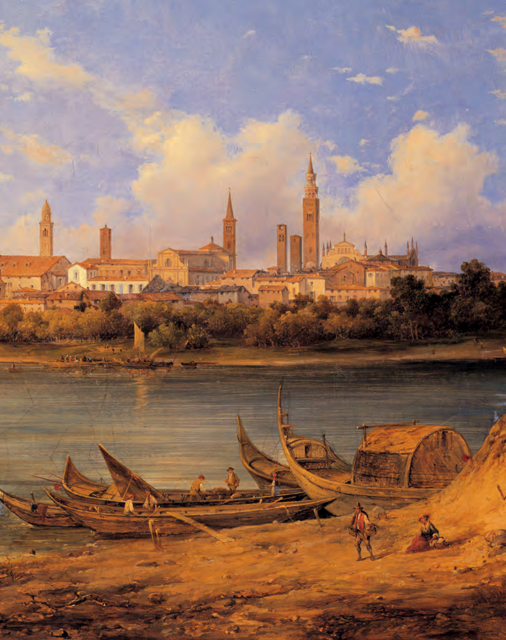
Felice Giuseppe Vertua, Vue de la ville de Vérone depuis les rives du Pô , 1855, Palazzo Comunale, Crémone (Italie).