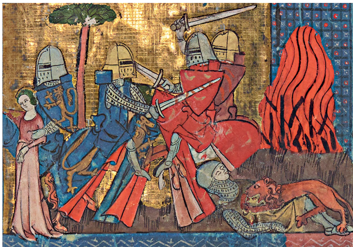
Yvain ou le Chevalier au lion de Chrétien de Troyes, détail d'enluminure, vers 1325.